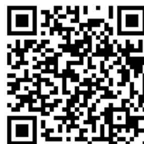
QR-Code UME Plus

Unter https://plus.ume.de finden Sie eine Übersicht zahlreicher Kontakt-, Unterstützungs- und Mitarbeitendenbenefit-Möglichkeiten der Universitätsmedizin Essen.