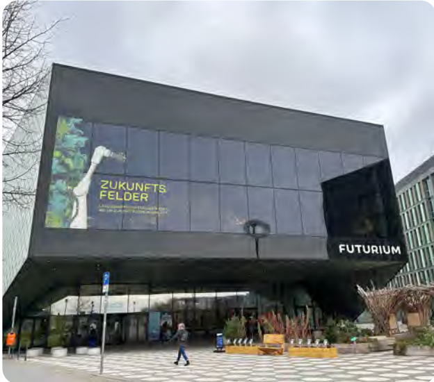
Interessante Diskussionen im Futurium in Berlin

Vision Zero Oncology hat es sich zum Ziel gemacht, die Anzahl der vermeidbaren krebserkrankten Todesfälle gegen null zu bringen. Auf der Herbsttagung am 26. November 2025 im „Futurium“ in Berlin war die Universitätsmedizin Essen als neues institutionelles Mitglied an der Programmgestaltung beteiligt.