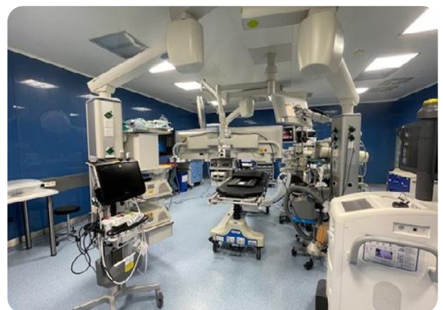
Vorbereitung einer Narkoseuntersuchung

Zu den flexiblen Eingriffen gehören etwa BAL (Broncho-alveoläre Lavagen), Kathetersaugbiopsien, Bürstenabstriche, Zangenbiopsien oder Chartisuntersuchungen zur möglichen Emphysemtherapie. Unter Vollnarkose in einer speziellen Jet-Beatmung mit starrem Bronchoskop finden tägliche endobronchiale Ultraschall-Untersuchungen statt und ersetzen in großem Maße die Mediaskopie, die früher im OP durchgeführt wurde. Weitere Eingriffe sind Blutstillungen, Stentanlagen, Tumorabtragungen, Ventileinlagen oder Fremdkörperentfernungen. Entsprechend kommen in Diagnostik und Therapie hochmoderne Techniken zum Einsatz.