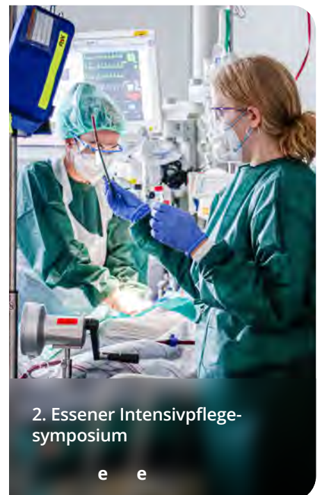
2. Essener Intensivpflegesymposium