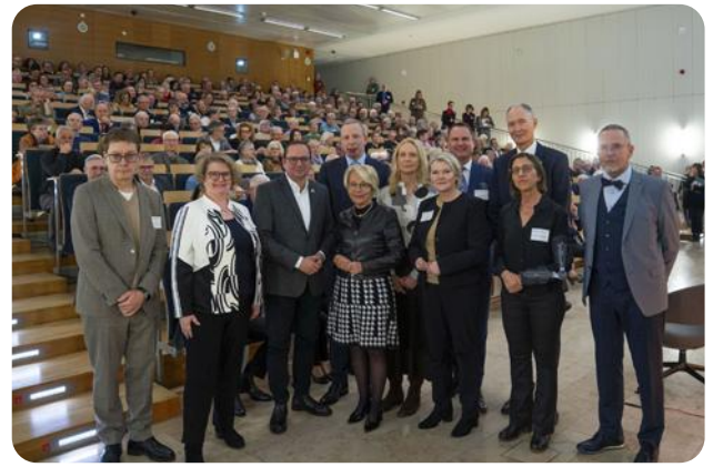
Volle Ränge beim Neujahrsempfang