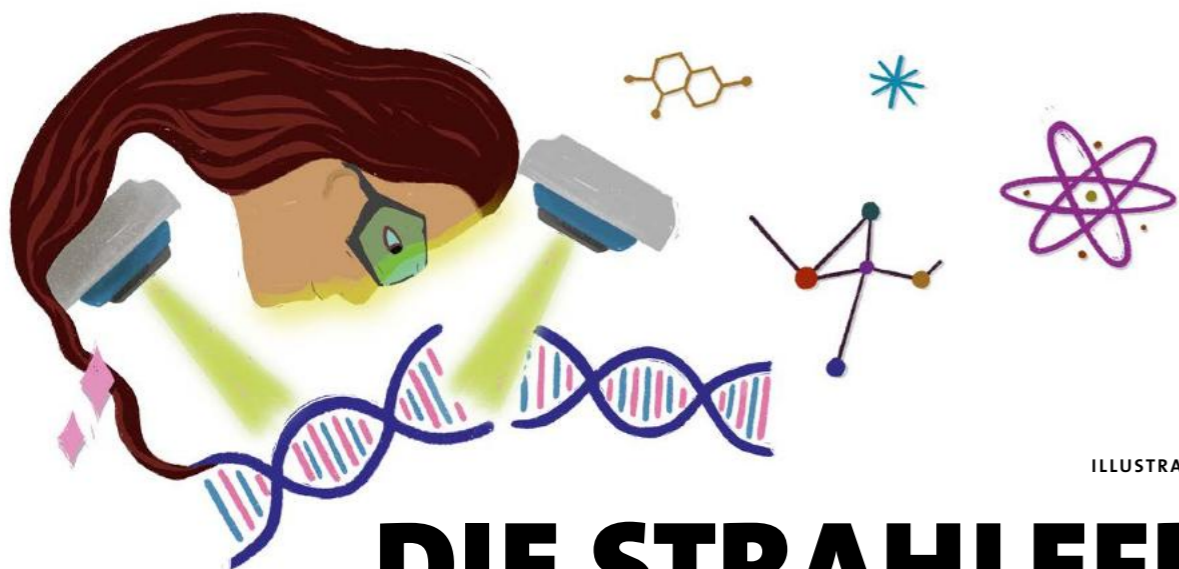
ILLUSTRATION: MARIA MARTIN