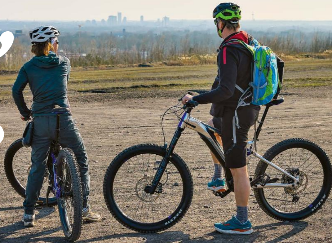
MONDLANDSCHAFT Die Schurenbachhalde im Norden der Stadt ist ein Highlight des Zollvereinsteigs.

Essen gilt als „Trendreiseziel 2025“ in Deutschland. Das ist das Ergebnis einer Auswertung von Klick-, Such- und Buchungsanfragen der Plattform booking.com. Da möchte man natürlich wissen: Wie kann das sein? Und ist die Welt schon zu Gast in der Ruhrmetropole? Ein Realitätscheck.