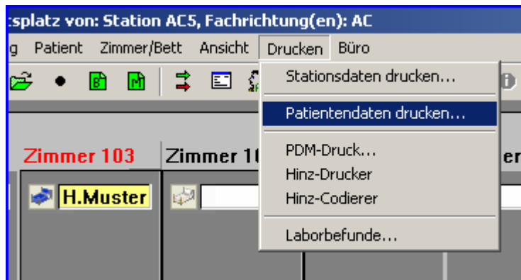
Abb. 1: Menüpunkt „Drucken“

Im Stationsarbeitsplatz von medico//s wählen Sie zunächst den Patienten aus, für den Sie den Einsendeschein für die Mikrobiologie benötigen. Sie können dann entweder über das Programm-Menü „Drucken“ den Menüpunkt „Patientendaten drucken...“ auswählen, oder über das sogenannte „Kontextmenü“ (mit der rechten Maustaste auf den Patientennamen klicken) ebenfalls den Menüpunkt „Patientendaten drucken...“ auswählen: