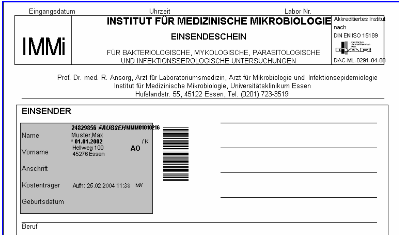
Abb. 3: Kopfteil Einsendeschein Mikrobiologie

Der Einsendeschein ist dann bereits mit den Patientendaten (= Patientenetikett) ausgefüllt. Sie müssen jetzt nur noch die üblichen Angaben ausfüllen: